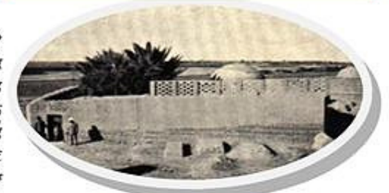
Gurudwara in Baghdad